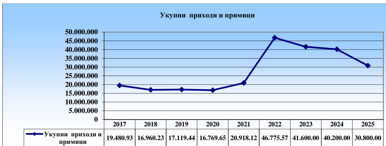
Графикон 1: Укупни приходи и примици

Град Лакташи се 2017. године кредитно задужио, тако да је у 2017. години прилив по основу задужења у износу од 4.000.000,00 КМ у структури износио чак 20,53%, што је значајно утицало на укупан износ буџета. Средства су у оквиру расхода кориштена за пријевремени откуп емитованих обвезница – отплату дуга и плаћање укалкулисаних обавеза из претходног периода. Такође, у 2022. години Град се кредитно задужио у износу од 4.000.000,00 КМ, а средства су искориштена за инфраструктурне пројекте.