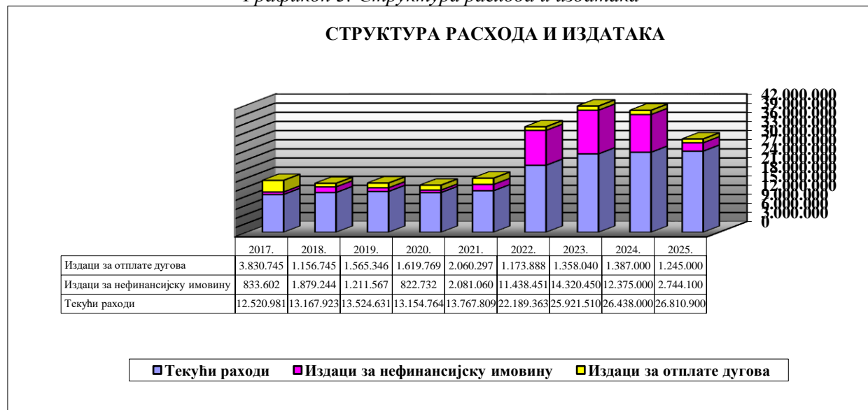
Графикон 3: Структура расхода и издатака

У претходном периоду приходи су били већи од расхода и финансијски резултат је био позитиван, односно остварен је суфицит који се користио за покриће дефицита из ранијих година и законом предвиђене намјене (кад је у питању трошење намјенских средстава).